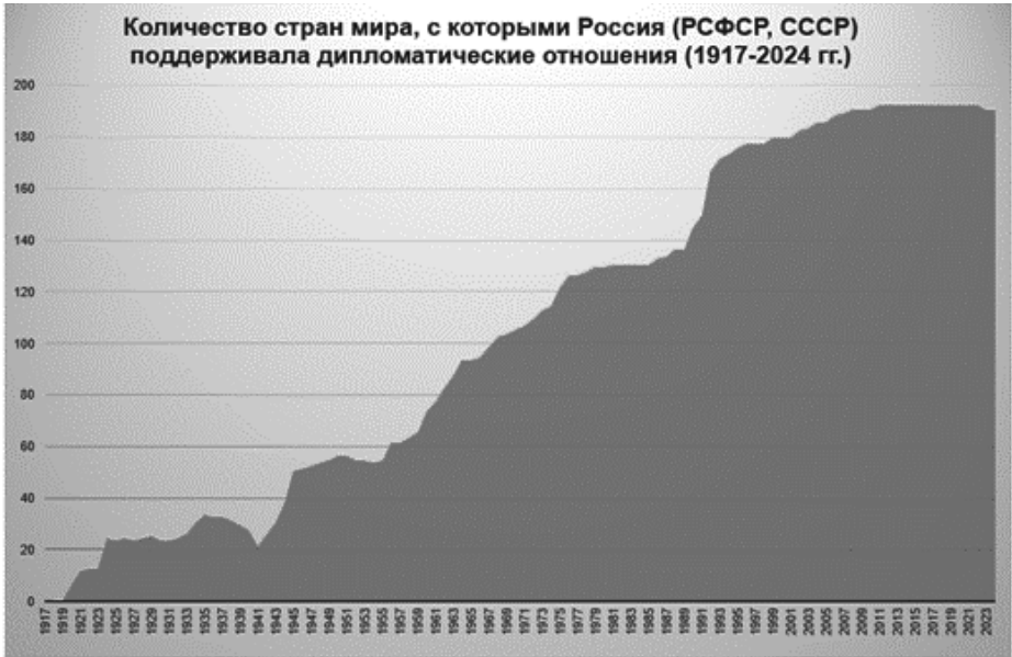
Рис. 1. Количество стран мира, с которыми Россия (РСФСР, СССР) поддерживала дипломатические отношения (1917–2024 гг.)