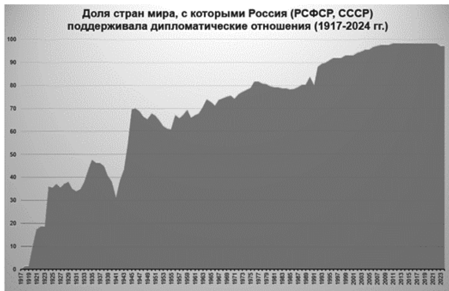
Рис. 2. Доля стран мира, с которыми Россия (РСФСР, СССР) поддерживала дипломатические отношения (1917–2024 гг.)

Figure 2. Share of countries with which Russia (RSFSR, USSR) maintained diplomatic relations (1917–2024)