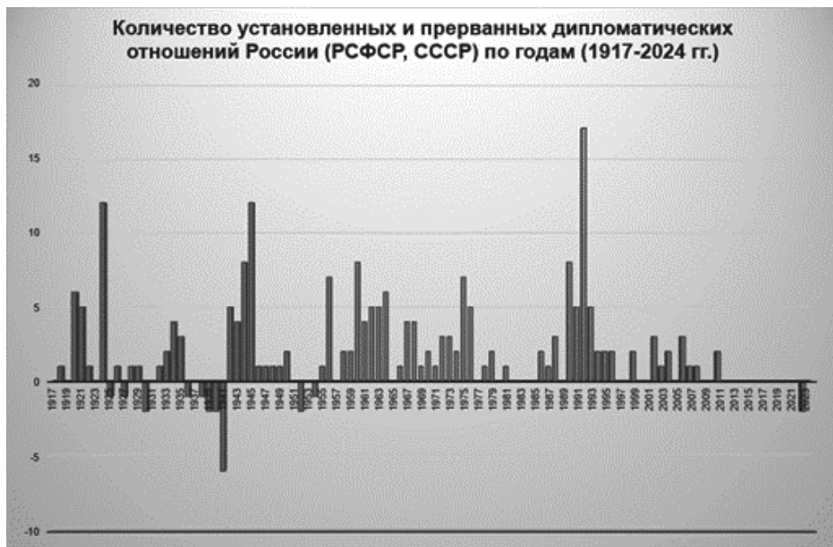
Рис. 3. Количество установленных и прерванных дипломатических отношений России (РСФСР, СССР) по годам (1917–2024 гг.)

Figure 3. Number of established and terminated diplomatic relations of Russia (RSFSR, USSR) by years (1917–2024)