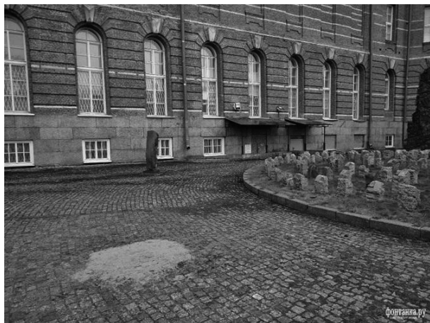
Рис. 6. Бюст востоковеда Ахмет-Заки Валиди «съехал» с филфаковского дворика. Прокуратура рассмотрела в нём пособника нацистов

Figure 6. The bust of orientalist Akhmet-Zaki Validi "moved" from the Philfakovsky courtyard. The prosecutor's office considered him a Nazi collaborator