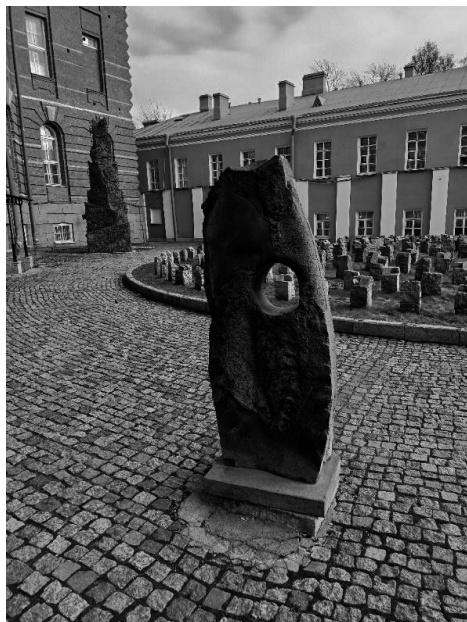
Рис. 7. Место памятника