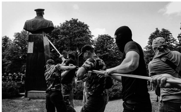
Рис. 2. Минобороны РФ увидело в сносе бюста Жукову движение Украины к варварству

Figure 2. Russian Defense Ministry sees Ukraine's demolition of Zhukov's bust as a move toward barbarism