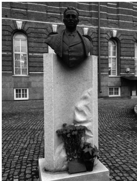
Рис. 5. Бюст востоковеду Валиди убрали с территории СПбГУ после проверки прокуратуры

подарило памятник Ахмет-Заки Валиди Тогану не кому-нибудь, а Санкт-Петербургу. Причём не только Санкт-Петербургу, но и Санкт-Петербургскому государственному университету, федеральной организации, установив именно во дворе нашего университета вот этот самый бюст, который здесь изображён.