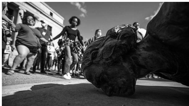
Рис. 3. В США за время антирасистских протестов снесли 33 памятника Колумбу