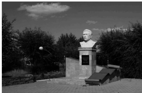
Рис. 8. В одном из городов Башкирии пропал памятник Ахмет-Заки Валиди

В 2013 году была проведена реконструкция, и памятник дополнили списком его заслуг, которые были написаны на свитке. Вот здесь видно золотой такой свиток.