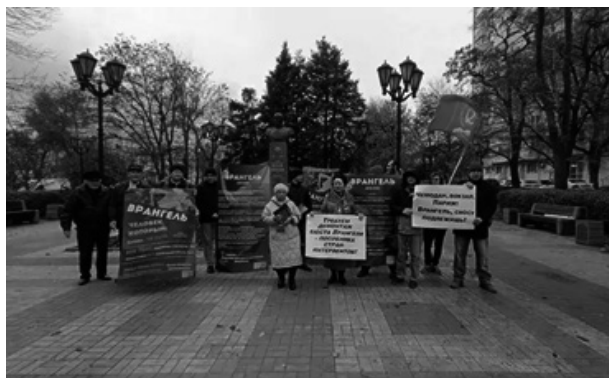
Рис. 1. В Ростове коммунисты провели пикеты против установки бюста барону Врангелю

Вот фотографии, находящиеся в открытом доступе в сети Интернет, которые как раз демонстрируют уровни масштаба и причины, почему следует заниматься этой проблематикой. Первое фото — это протест с использованием городских символов в большей степени регионального или местного масштаба.